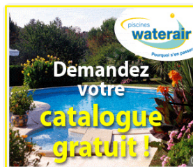
Le pavé Format : 300 x 250