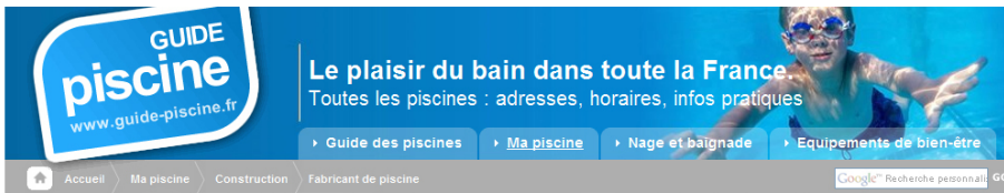
La bannière ou leaderboard Format : 728 x 90